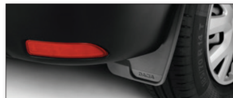
Přední a zadní zástěrky

V ceně vozu není zahrnuta povinná výbava.