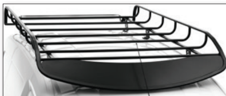
Střešní ocelová galerie