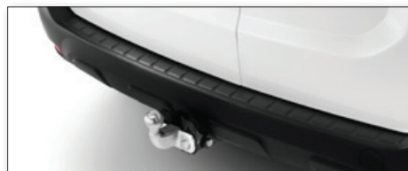
Tažné zařízení Standard vč. kabeláže